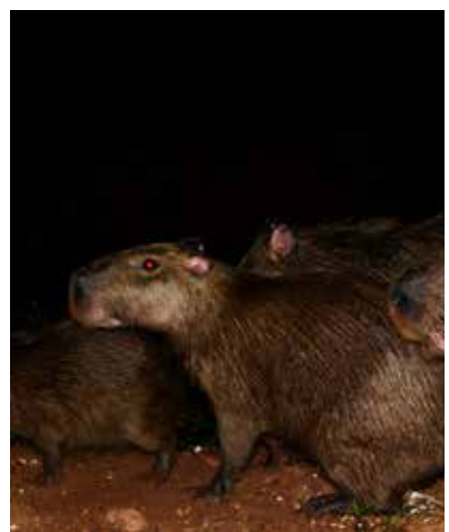
Capibara grande / Greater Capybara ( Hydrochoerus hydrochaeris ).